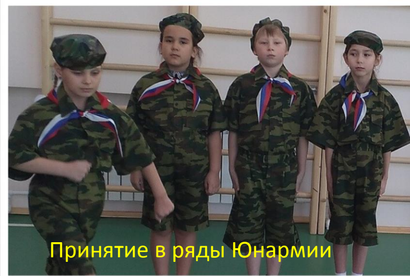
Принятие в ряды Юнармии